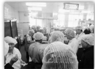
(株)松月堂本店 昭和元年開業の老舗の実力 長い歴史と伝統を守りながら新時代のニーズに応える