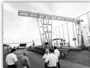
(株)三和製作所 常識を大きく変えるエコロジー商品開発 見て初めて分かった圧倒的スケール感・技術力と開発力

部長・深山三和支部長の会社を訪問・見学させていただき工場見学会を実施いたしました。